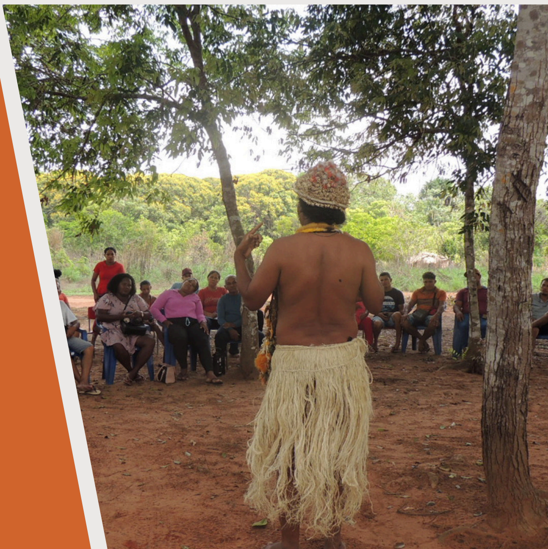
Comunidade Quilombola do Grotão-To. 2025.