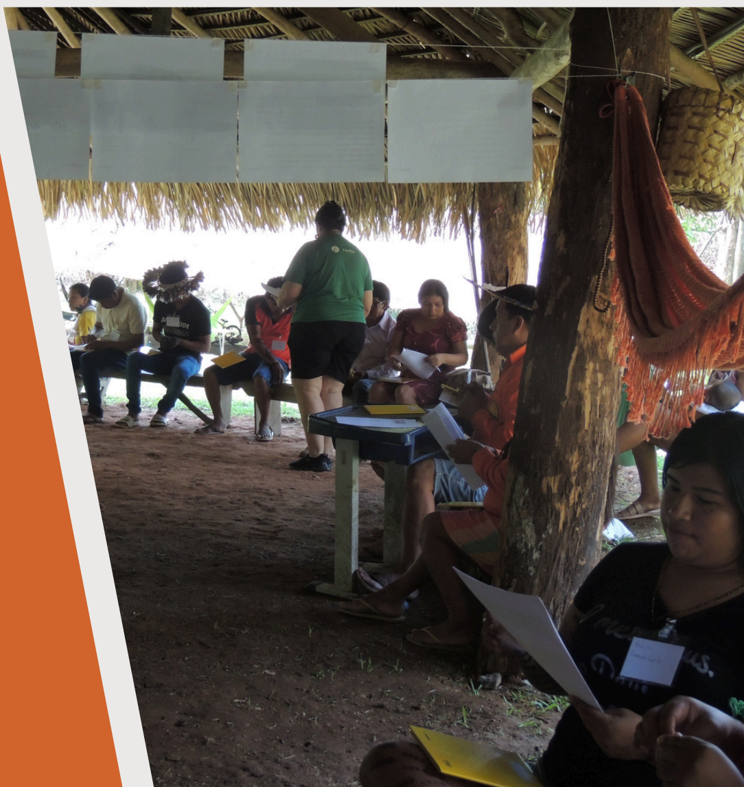
TI Paiter Suruí. Rondônia. 2024 (Imagem: própria)

O Instituto Educa, é uma instituição sem fins lucrativos, fundada a partir de pessoas que possuem atuação junto aos Povos Originários e aos Povos e Comunidades Tradicionais, levando para os territórios tradicionais, formação para o mercado de trabalho, capacitação em gestão de projetos sociais, educação para as relações étnico-raciais e direitos humanos. Nossas formações vão ao encontro do respeito ao autorreconhecimento e das especificidades dos diferentes segmentos dos Povos e Comunidade Tradicionais e dos Povos Originários que estão presentes de norte a sul deste país.